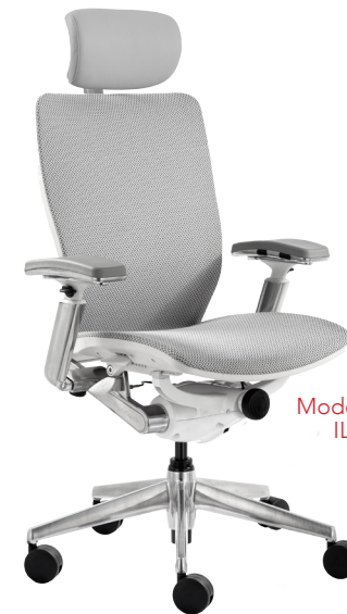
Modèle 7300WH ILLUSTRE